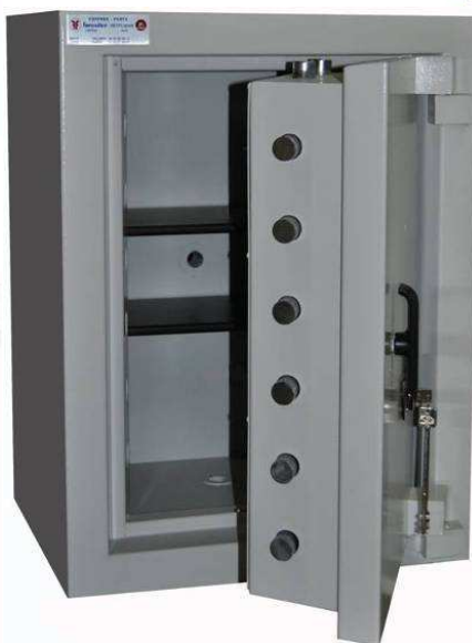
GP 4.80 classe IVE A2P H : 800 L : 600 P : 500 mm 560 Kg pour 85 Litres 2 serrures à clé double panneton