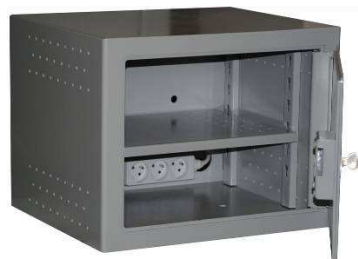
TA 84 B5 Ventillé Pour Serveur Informatique