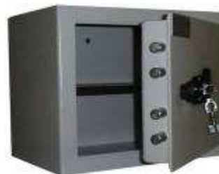
TA 84 B3 Clé DP