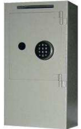
TA BLOC 12 mm - 6 FACES 650x350x250 Avec fente de dépôt Socle 400 Serrure Safe BASIC