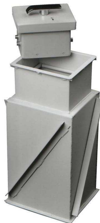
COFFRE FORT A ENTERRER