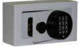
TA 84 B0 Clavier Motorisé