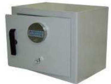
TA 84 B3 Clavier + clé de secours