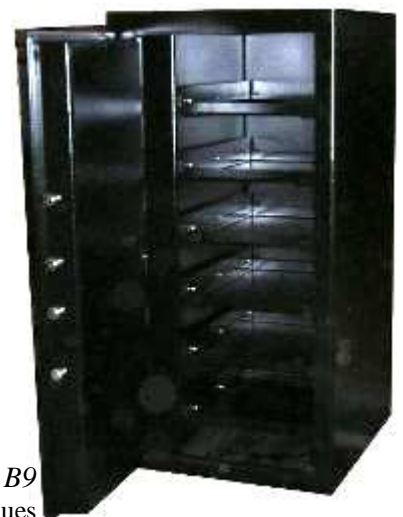
TA 84 B9 Tablettes télescopiques