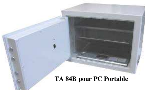
TA 84B pour PC Portable