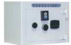
TA 84 B3 Clé DP + 99.E Fente 220x25 avec anti-pêche