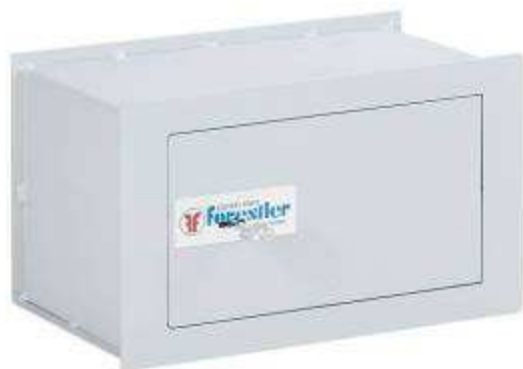
TA 82 - E1