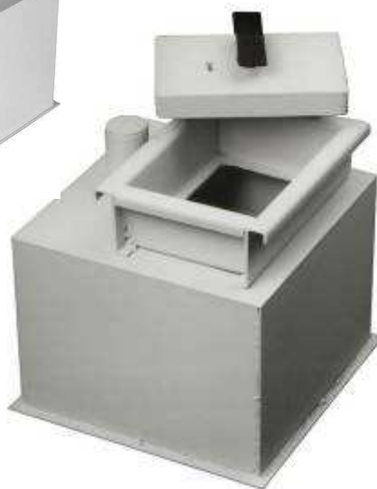
COFFRE DE SOL