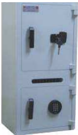
TA 84 B6 sur B5 fente Clé lagard et clavier électronique