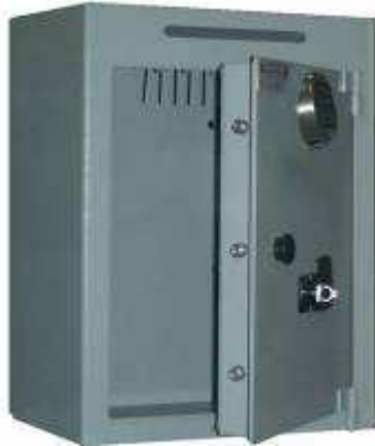
TA 88 – B7 Fente de dépôt 220 * 15 Système anti- pêche Clé LE D.P. + Clavier