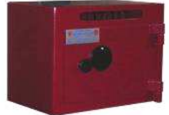
TA 84 - B3 FENTE