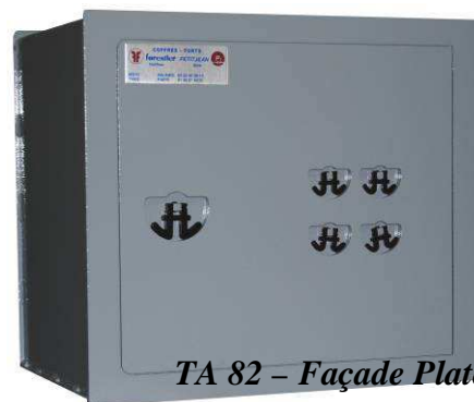
TA 82 - Façade Plate