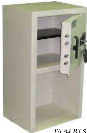
TA 84 B3 Sur socle