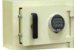
TA 84 - B2 CE