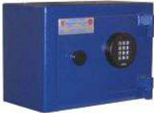
TA 84 - B3 CE