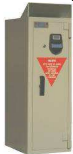
TA bloc 12mm / 6 FACES Serrure HORO 1500 Dim 950x550x450 Avec fente de dépôt