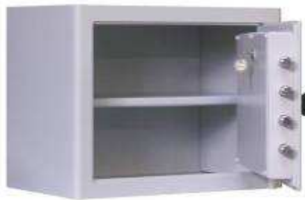
TA 1212 B4 Clé DP + Clé Capturée à l'ouverture.