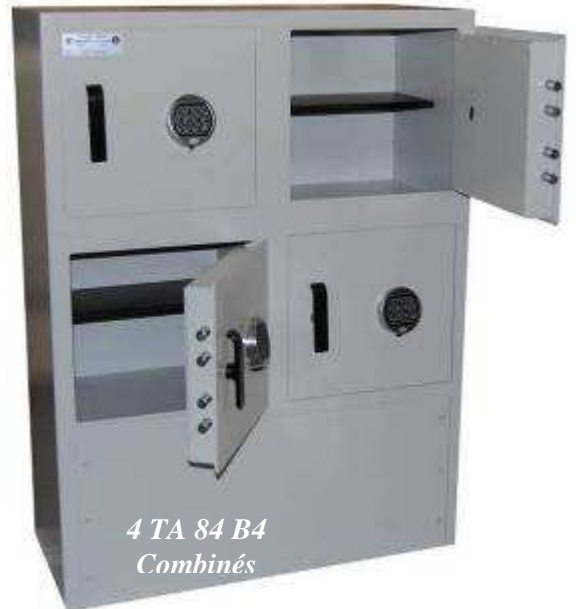
4 TA 84 B4 Combinés