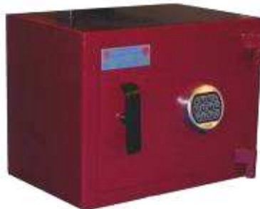
TA 84 - B5 CE