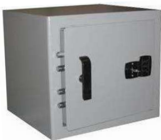
TA i 35 Ignifuge