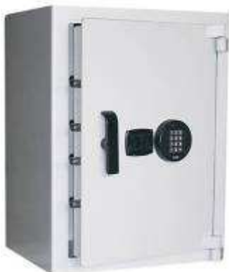
TA 84 - B7 Clé DP