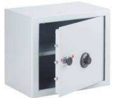
TA 126 - B5 CD