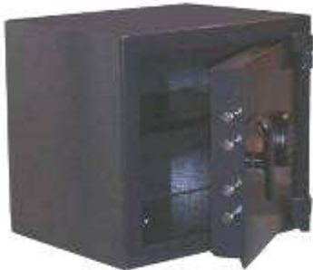
TA 84 B6 CE