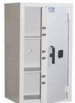
TA 1212 - B8 Clé D.P.