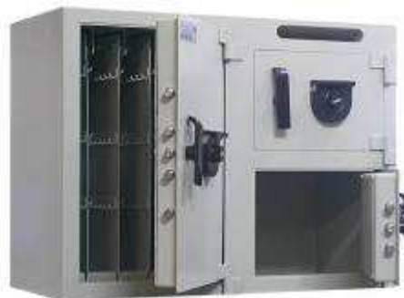
TA BLOC (Caisse 2.5mm & Porte 5mm) Dim : 600 x 800 x 380 CC216 + TA type B3 avec fente de dépôt (220x25) sur TA type B3