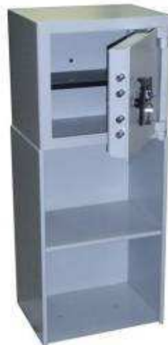
TA 126 B5 Clé DP