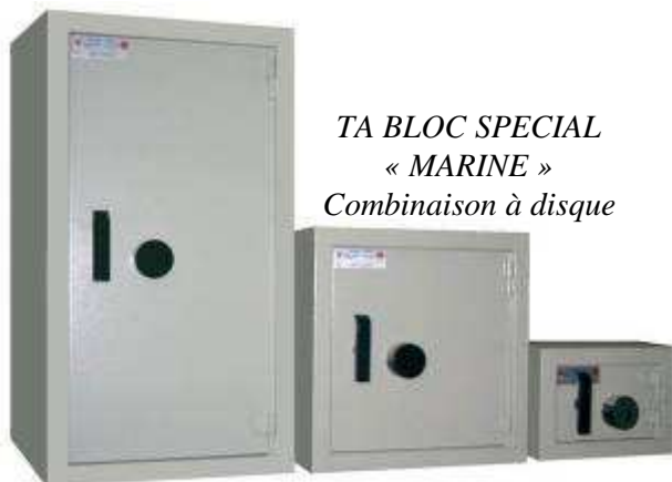
TA BLOC SPECIAL « MARINE » Combinaison à disque