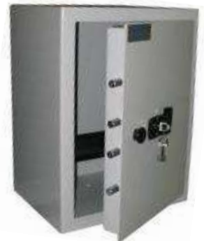
TA 84 B7 Clé DP