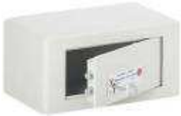
TA 126 - B0 Cl2 DP