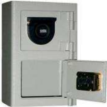
TA BLOC DOUBLE 12 mm - 6 FACES Dim : 370 x 250 x 150