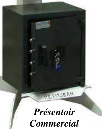
Présentoir Commercial pour TA 84 Bloc