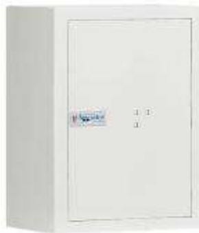
TA 1212 - B6