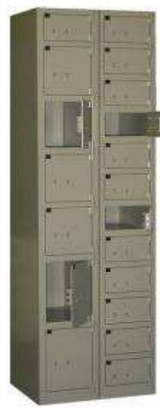
2 Colonnes jumelées : 1 colonne panachée « 1C12 + 4C8 + 2C6 » et 1 colonne « C12 »