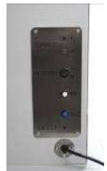
Gestion par Commande à boutons