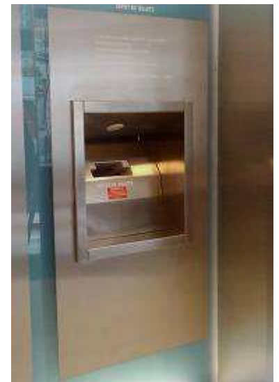
Tête de dépôt DVS réalisée en INOX