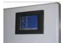
Gestion par écran