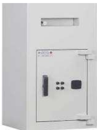
BC 60 DFC

(Voir coffre fort combiné pour l'option sécurasac)