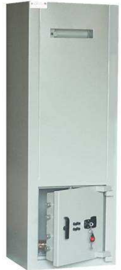
BC 80 DFC Dos sur BC 60T