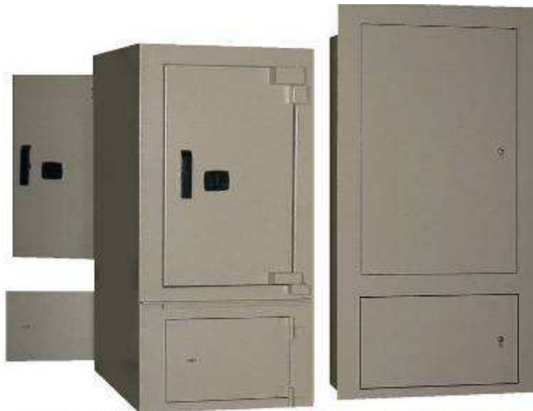
NG 62 TDF AXYTRANS SUR PASSE OBJETS PORTILLON ACIER