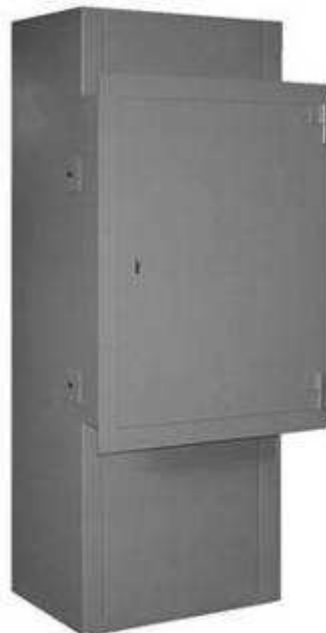
Option Portillon Acier