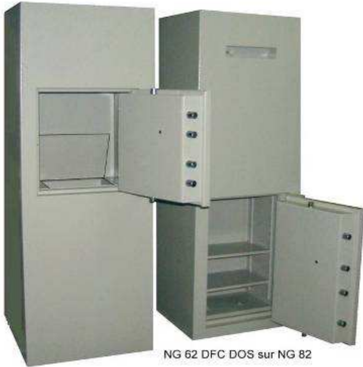
NG 62 DFC DOS sur NG 82