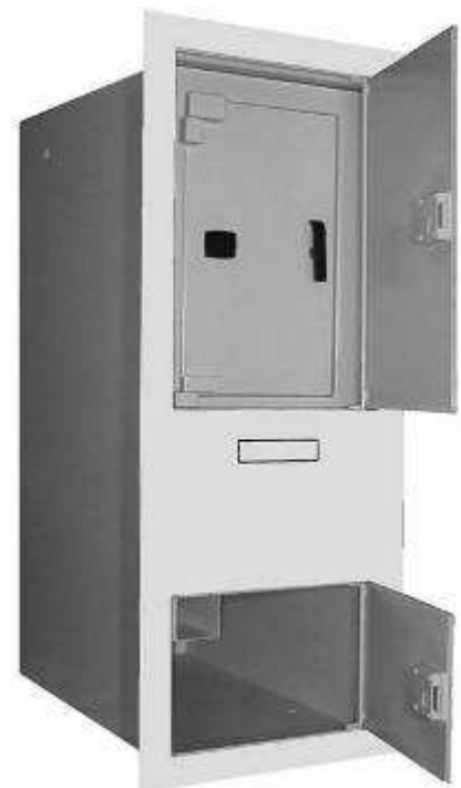
Côté EXTERIEUR Portillon avec Façade INOX